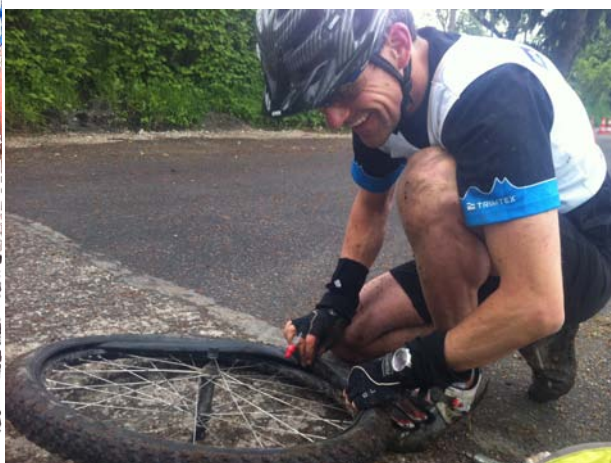
Chute et crevaison à l'aventure chablaisienne !!!